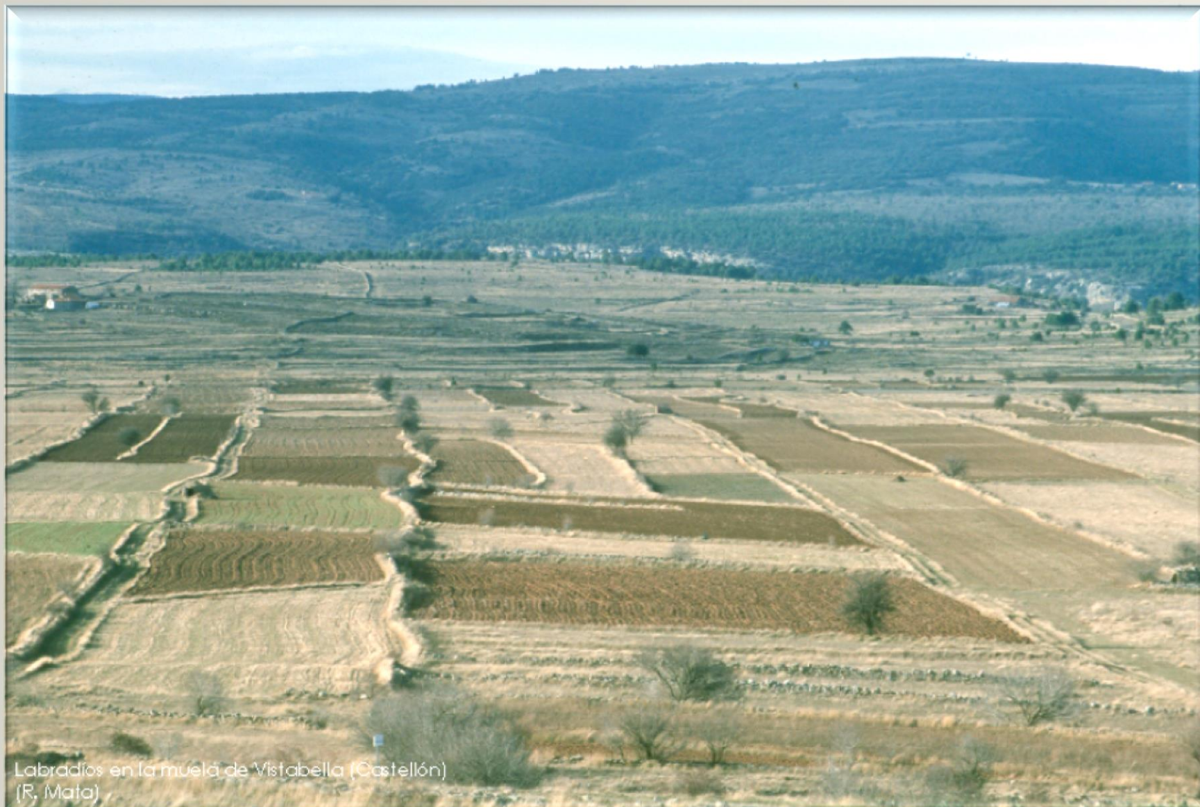
Labrados en la muela de Vistabella (Castellón)